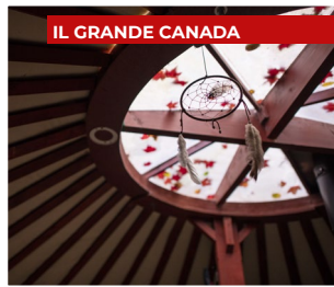
IL GRANDE CANADA