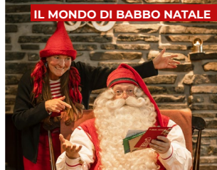
IL MONDO DI BABBO NATALE