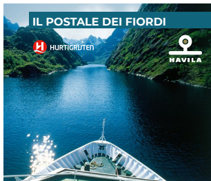
IL POSTALE DEI FIORDI