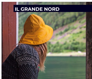
IL GRANDE NORD