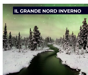
IL GRANDE NORD INVERNO