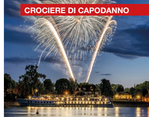
CROCIERE DI CAPODANNO